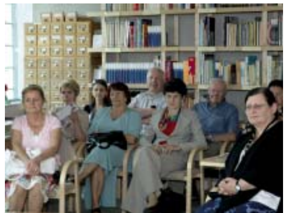
Olimpijski Wieczór Poetycki. Publiczność w Czytelnicy MSiT