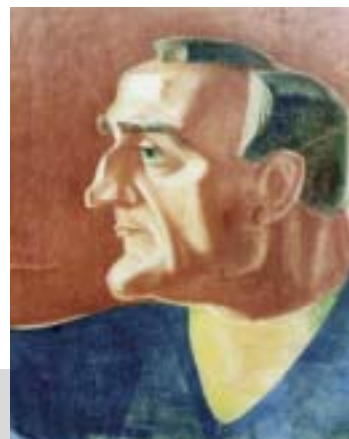
Stanisław Szukalski, Zbyszko Cyganiewicz , kredka, 75 x 70 cm.

Szukalski znany jest przede wszystkim ze swych prac rzeźbiarskich, jednak jego kontrowersyjna, wzbudzająca wiele sporów twórczość, wciąż nie jest dostatecznie zbadana i znana w Polsce, tym bardziej cieszy nas, że dzieło tego artysty znalazło się w zbiorach Muzeum.