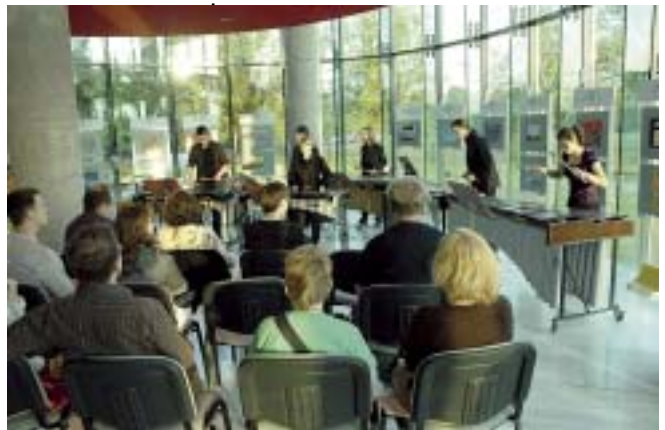
Występ uczniów z Zespołu Państwowych Szkół Muzycznych nr 4 im. Karola Szymanowskiego w Warszawie podczas Nocy Muzeów.