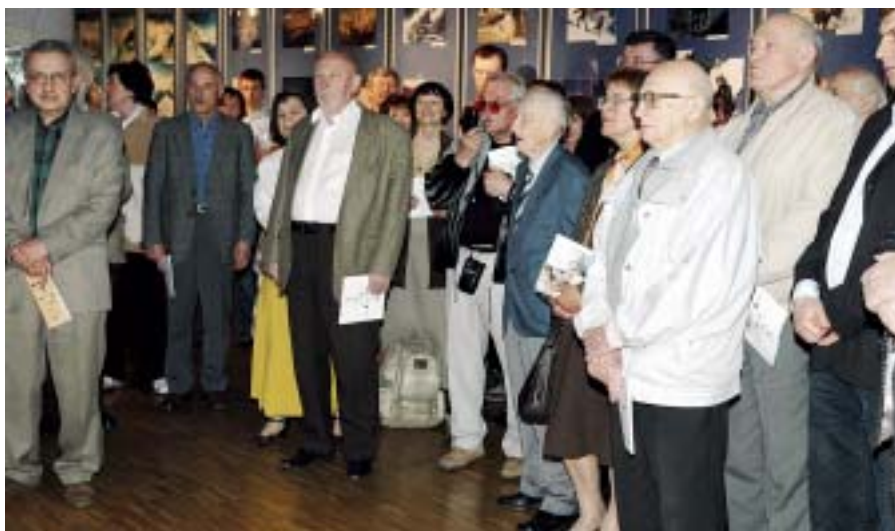
Goście XV PFA podczas otwarcia wystawy „Z Podola w najwyższe góry świata”.