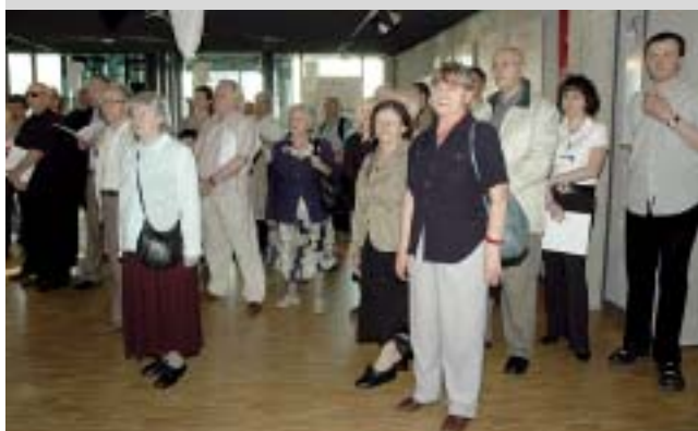
Otwarcia wystawy towarzyszyło duże zainteresowanie publiczności.