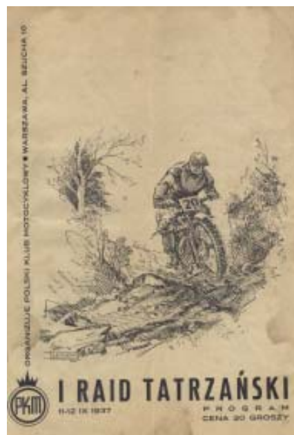
Okładka programu I Rajdu Tatrzańskiego.

wyrazami bardzo serdecznej przyjaźni ofiaruje L. Chwistek /29.IX.1937”.