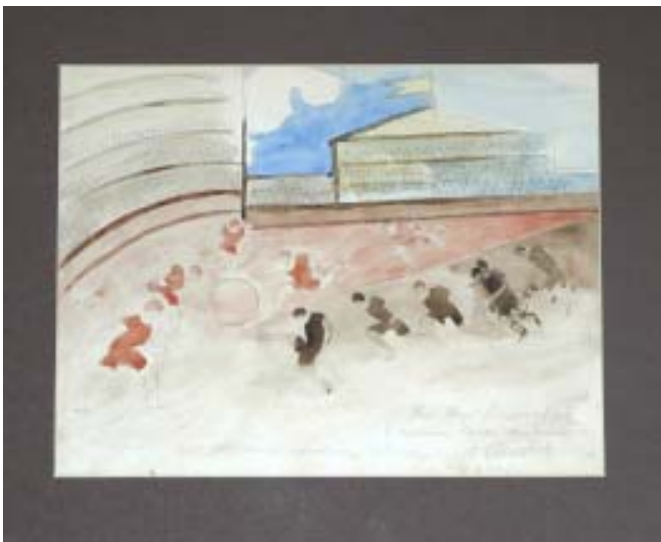
Leon Chwistek, Mecz piłkarski, 1937, ołówek, akwarela/papier.

Leon Chwistek (1844–1944) polski malarz filozof i matematyk. Był też teoretykiem sztuki, członkiem awangardowego ugrupowania Formiści, twórcą teorii formizmu w malarstwie.