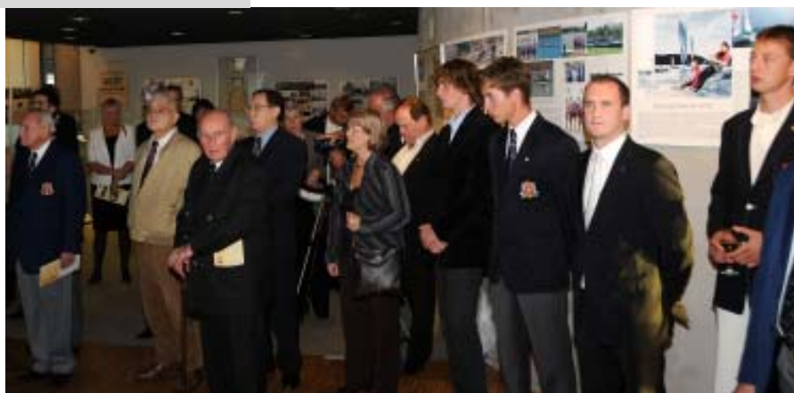
Goście Jubileuszowego Wieczoru WTW podczas wernisażu wystawy.