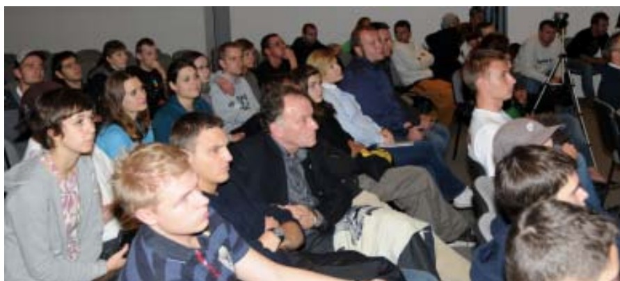
Publiczność w oczekiwaniu na końcową punktację.

Dodatkową atrakcją dla przybyłych gości było zwiedzanie Muzeum, prezentacja historii „zośki” i footbaga oraz konkursy z nagrodami, w trakcie których każdy mógł spróbować własnych sił w tej grze.