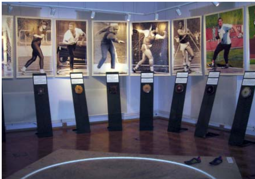
Fragment wystawy czasowej w Muzeum Sportu Estońskiego w Tartu.

Wszystkim kilkudziesięciu uczestnikom Seminarium ISPESH delegacja MSiT podarowała najnowszą publikację warszawskiego Muzeum „The History of Polish Sports and the Olympic Movement”.