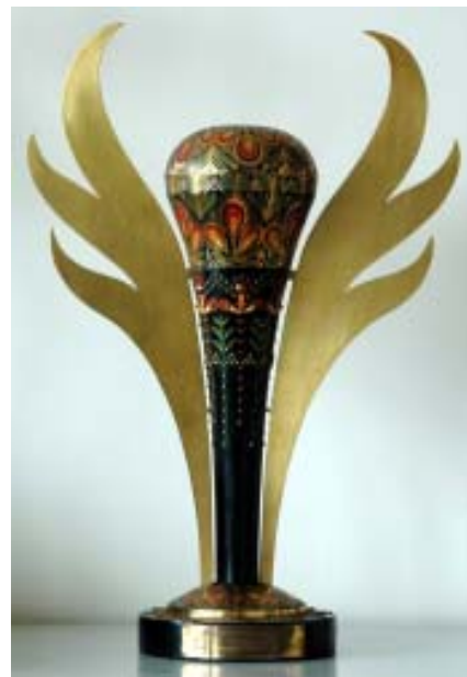
Puchar za zwycięstwo w I Rajdzie Tatrzańskim PKM, 1937.