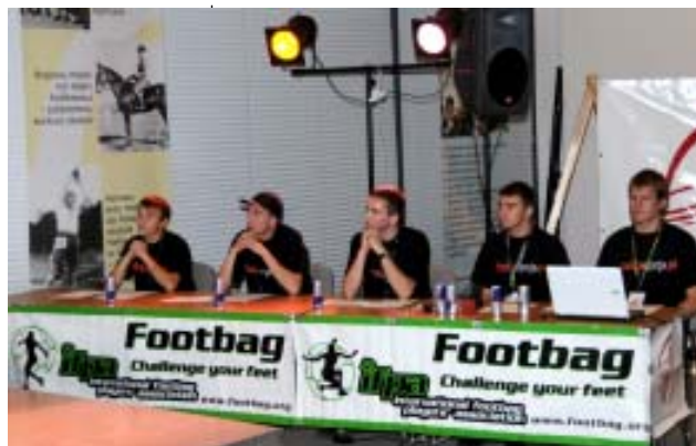
Sędziowie uważnie obserwowali zmagania zawodników.