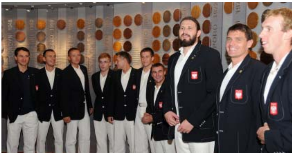
Bohaterowie Igrzysk w Pekinie w Sali Sławy Olimpijskiej.

Następna taka uroczystość odbędzie się w 2010 roku, po zakończeniu XXI Zimowych Igrzysk w Vancouver.