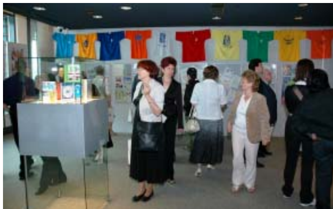
Goście konferencji prasowej i Sympozjum zwiedzają wystawę „XX Lat Międzynarodowej Parafiady Dzieci i Młodzieży”.