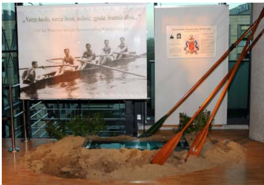
Fragment wystawy z okazji 130 – lecia WTW.

Wystawę otworzył prezes Warszawskiego Towarzystwa Wioślarskiego Bo-