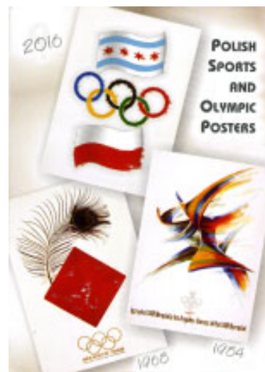
Zaproszenie na otwarcie wystawy „Polish Sports and Olympic Poster”