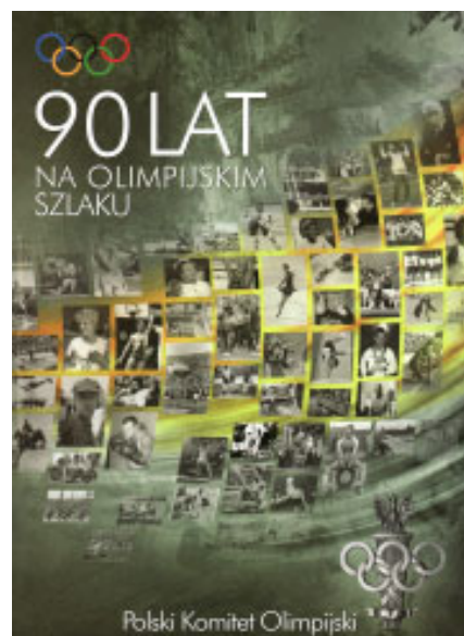
Strona tytułowa jubileuszowego albumu.

Ekspozycja stała Muzeum Sportu i Turystyki prezentowana od końca 2006 roku na II kondygnacji Centrum Olimpij-