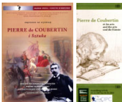
Foldery wystawy wydane przez MSiT oraz Deutsches Sport & Olympia Museum

Wernisaż wystawy w dniu 12 października był wprowadzeniem do głównych obchodów jubileuszu Polskiego Komitetu Olimpijskiego. Specjalny gość wieczoru pan Ivan de Navacelle de Coubertin , posiadacz kilku prac prezentowanych na wystawie, barwnie opowiedział o tradycjach artystycznych rodziny de Coubertin i oprowadził gości po wystawie.