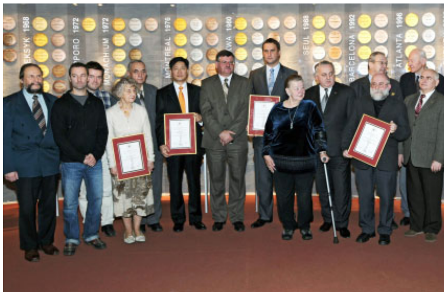
Darczyńcy MSiT obecni i na spotkaniu Dary i Darczyńcy 2007 -2009.