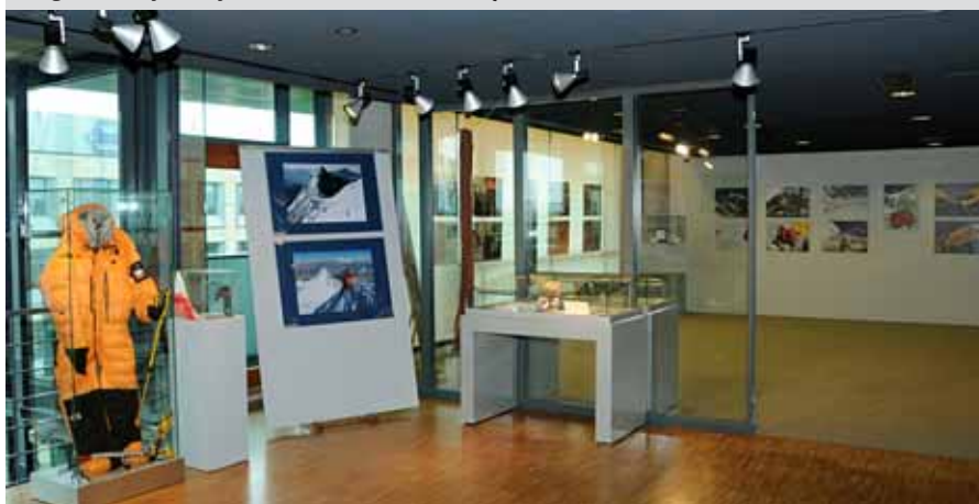
Fragment wystawy „Everest i Shisha zimą”.