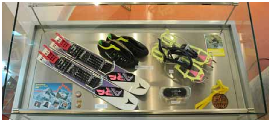
Gablota ze sprzętem sportowym używanym przez Wandę Rutkiewicz.

Na uwagę zasługuje sprzęt fotograficzny i elektroniczny używany przez Wandę Rutkiewicz . Wśród otrzymanych obiektów znalazła się również maszyna do pisania Consul , na której alpinistka napisała kilka książek i wiele relacji z wypraw.