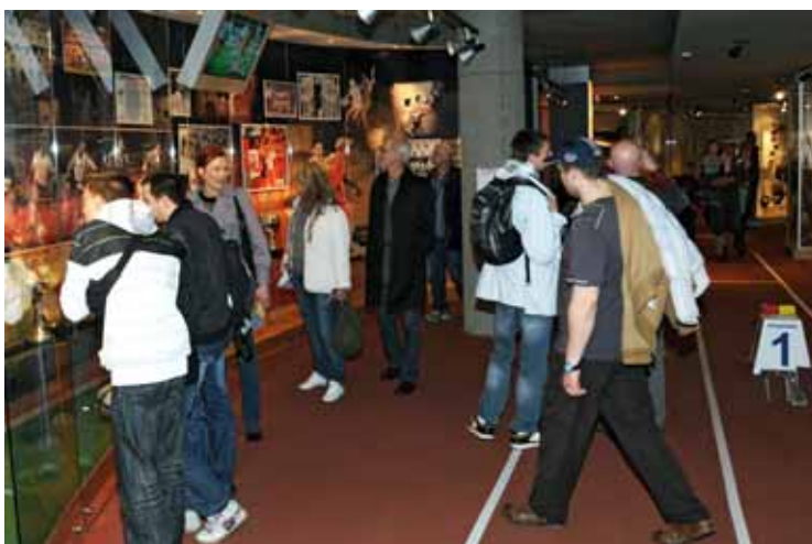
Goście Nocy Muzeów na ekspozycji stałej MSiT. Łącznie do Centrum Olimpijskiego przybyło ponad 2500 osób.