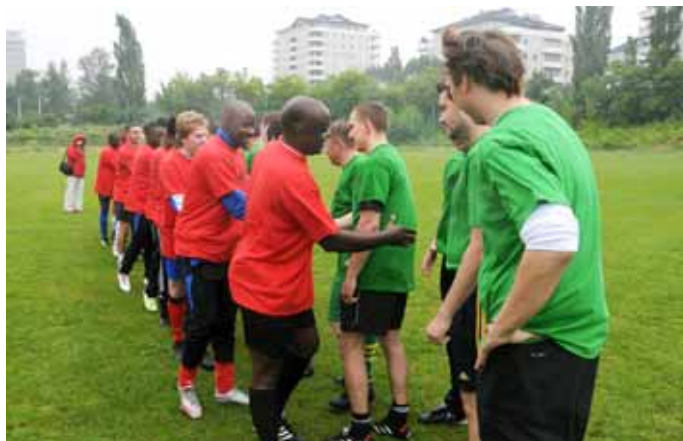
Początek meczu pomiędzy drużynami Muzeum i Przyjaciele a Reprezentacją Afryki na stadionie RKS Marymont.

Słynne trąbki wuwuzele oraz inne tradycyjne wyroby ludowe z RPA.