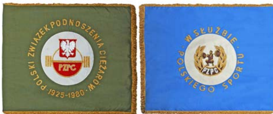
Awers i rewers sztandaru Polskiego Związku Podnoszenia Ciężarów z roku 1980.

Podczas uroczystości w Ciechanowie przekazano także do zbiorów MSiT medal z okazji 85-lecia działalności Polskiego Związku Podnoszenia Ciężarów.