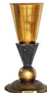
I Złoty Puchar Zakładów H. Cegielskiego w wyścigu motocyklowym, Poznań 1948.