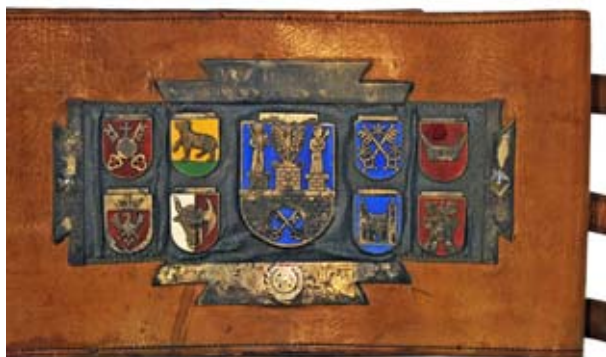
Pas, nagroda wyścigów motocyklowych KS Lechia Poznań 1948.

pewną ciekawostką jest informacja, że był on pierwszym zawodnikiem, który wjechał motorem na Kasprowy Wierch (1948), co odnotowały wówczas liczne gazety.